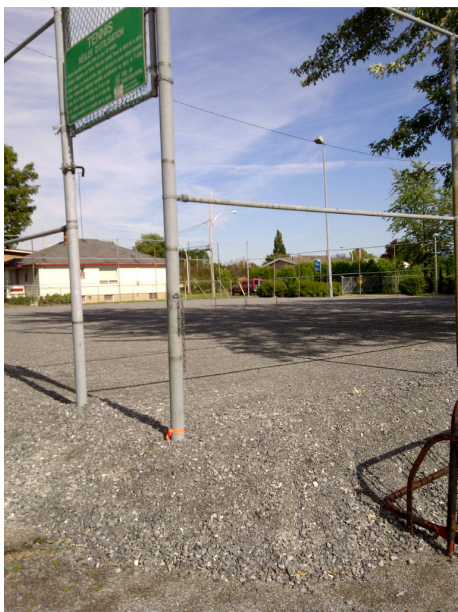
Terrain de tennis des Loisirs La Providence Septembre 2011